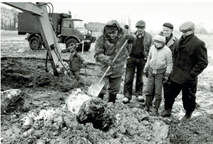
Januari 1981 - Opraving vliegtuig resten bij Menkhorst

De expositie zal zondag 4 mei van 18.00 tot 22.00 uur en maandag 5 mei van 10.00 tot 18.00 uur te bezichtigen zijn in de Onze lieve Vrouw ten Hemelopneming kerk.