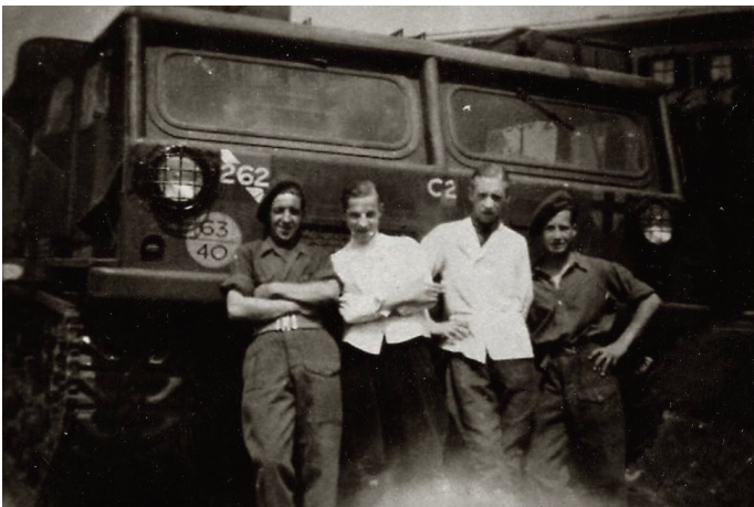
Beltrumse Bakkersknechten poseren met de bevrijders bij de Zuivelfabriek.

Met diverse verhalen, over de oorlogsslachtoffers, de vliegtuigcrashes en de bevrijding door de Britten. Ook verschillende foto's en krantenknipsels uit die periode zullen worden getoond.