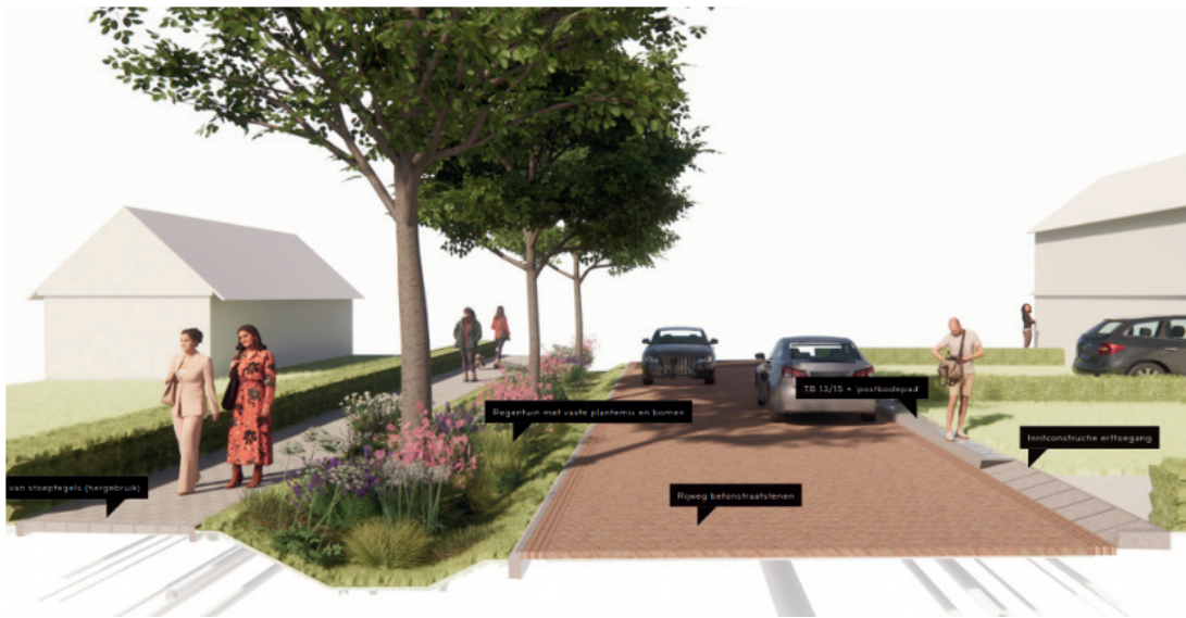
Sfeerimpressie van de nieuws ingerichte straten van Beltrum.