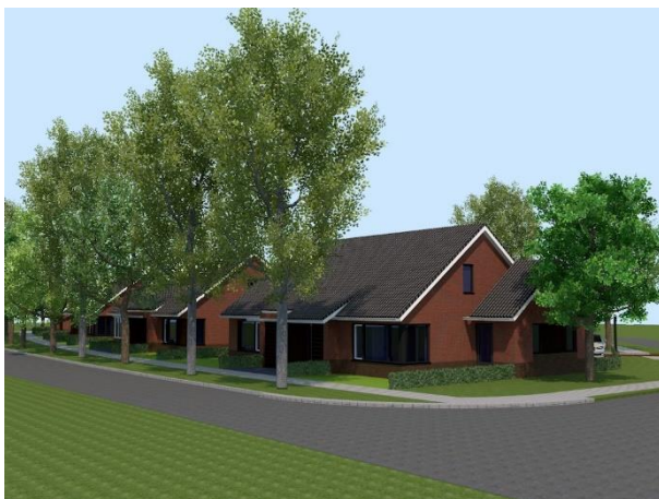
Figuur 2 Nieuw Jena

CPO Het Nieuwe Jena is als collectief het afgelopen jaar druk gewerkt aan de realisatie van de woningen. Met resultaat! De 2e helft van maart (2020) wordt gestart met de bouw van 8 levensloopbestendige woningen. De verwachting is dat in het najaar van 2020 de nieuwe bewoners hun intrek nemen. Dit zorgt direct weer voor wat doorstroming op de lokale woningmarkt. Zowel in de kern zelf als het buitengebied.