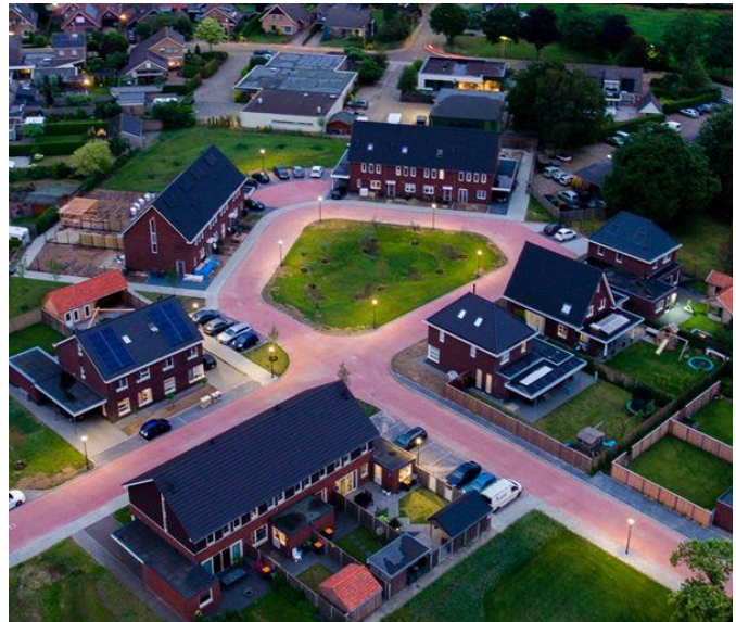
Figuur 1 Laatste afronding CPO 2.0 Grutto

Er is in overleg met de gemeente een plan gemaakt voor uitbreidingsmogelijkheden rondom woningbouw. Omdat na inventarisatie bleek dat er in de bestaande panden/ gebieden voorlopig geen mogelijkheden zijn voor nieuwe kavels. Daaruit is voorgekomen dat er op het huidige ABCTA nog enkele kavels beschikbaar komen en op de hoek van de Gaarden/Hoornhorstraat mogelijkheden zijn om de gewenste uitbreiding vorm te geven. Deze ontwikkelingen staan nog in de kinderschoenen. De buurt wordt nauw betrokken en de concept verkaveling is inmiddels ingetekend. Idee is dat er op het nieuwe plan zowel woningen voor jongeren als voor ouderen komen. Het CPO 2.0 project op de Grutto is inmiddels mooi aangeplant en na overleg met de buurt is de bestrating geplaatst.