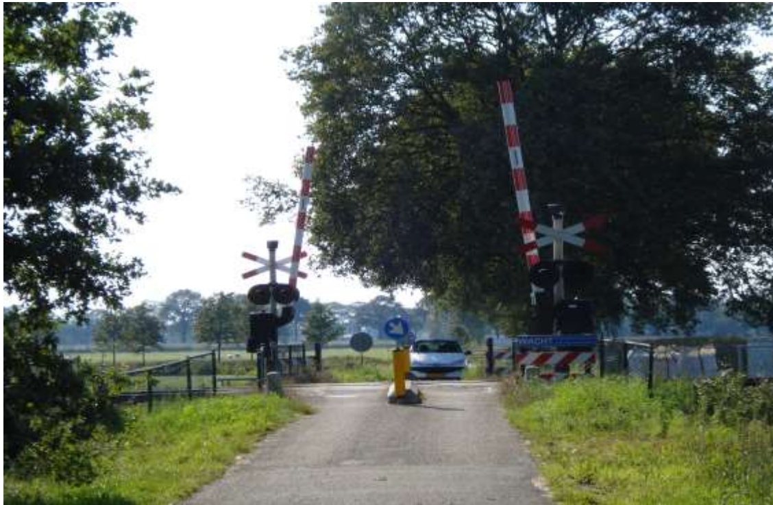
De spoorwegovergang via de Grensweg waar de bunker zich bevond.