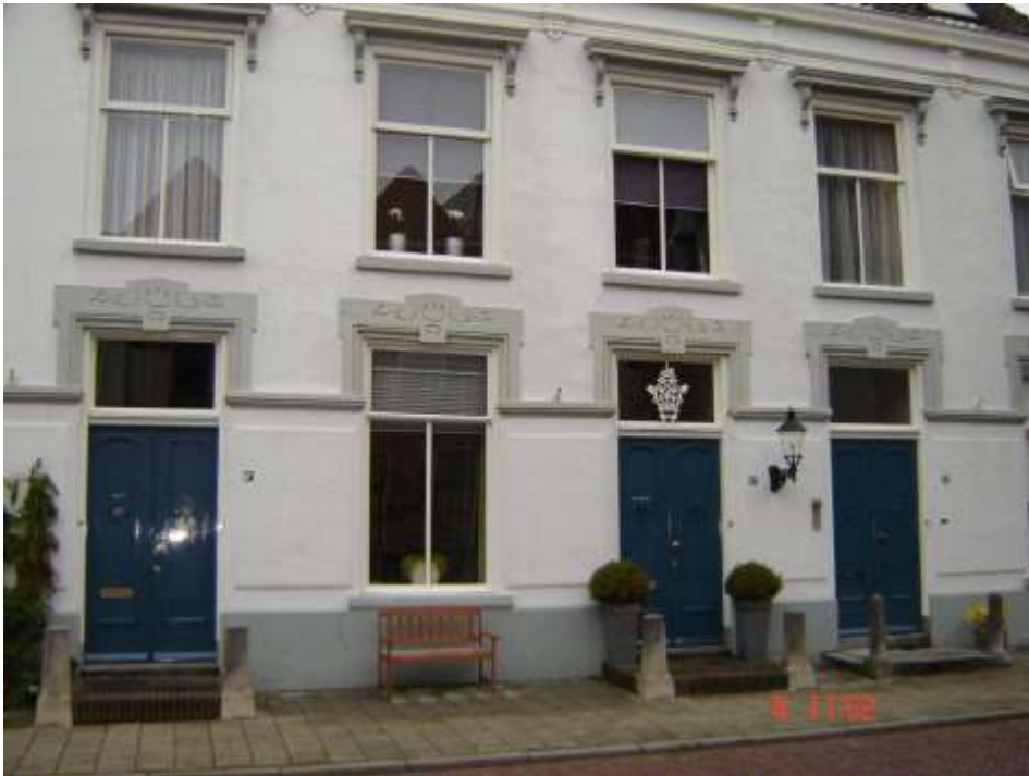
Laatste "huis" van Aaltje, het vroegere ziekenhuis aan de Koepoortstraat 16 in Doesburg.

Omdat geen van de zusters die haar toen verzorgden nog in leven is, blijft de vraag of Aaltje genoot van de goede verzorging en het rustige leven.