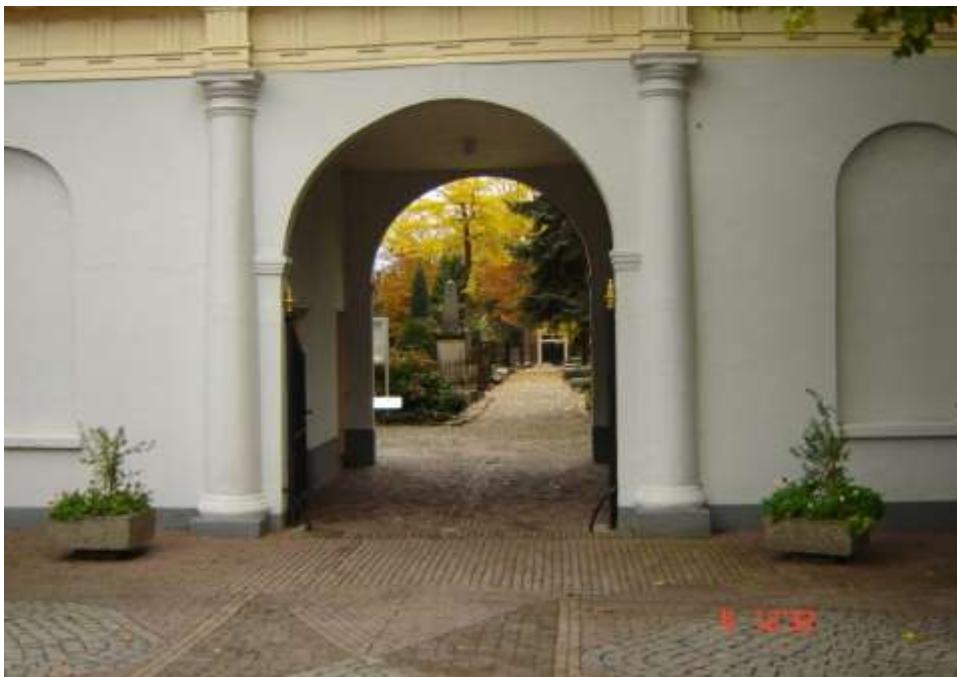
De prachtige monumentale poort naar de laatste rustplaats van Aaltje Kraake.

Op 16 september 1967 is Aaltje in haar 72 e levensjaar overleden en ze is begraven in Doesburg.