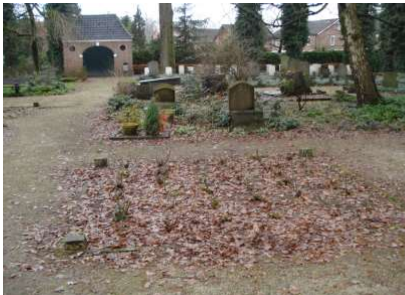
Op de voorgrond tussen de paaltjes het graf van Fokke Rotman met rozen beplant.

Samen met mijn broer Tonnie en de documenten hebben we de graven nr. 111 en nr. 123 gevonden en voor de zekerheid een foto gemaakt van beide graven.